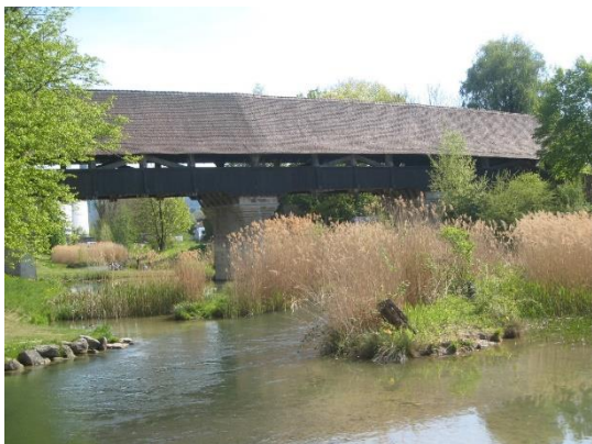
Entre Aarberg et Lyss, le long de l'Aar