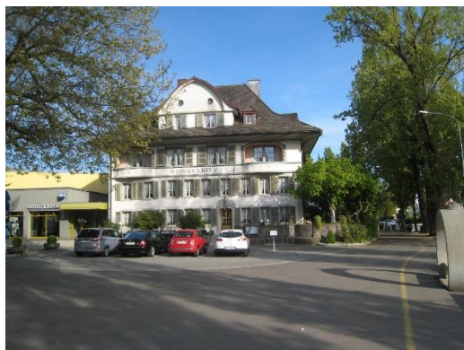
Lyss : Hôtel Weisses Kreuz