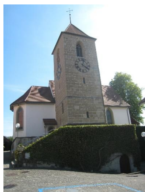
Aarberg : Eglise réformée